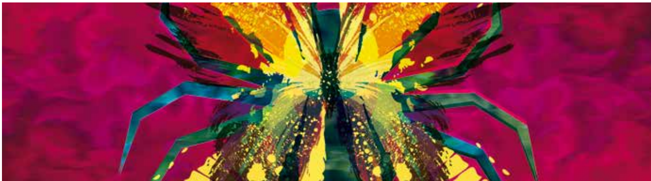
ILUSTRACIÓN: FERNANDO MICHEL CALDERÓN MIRANDA

“El hombre cree que el mundo está rebotante de belleza, y olvida que él es la causa de ella. Solo él le ha regalado al mundo la belleza; aunque, lamentablemente, se trate de una belleza humana.” El ocaso de los ídolos, Friedrich Nietzsche.