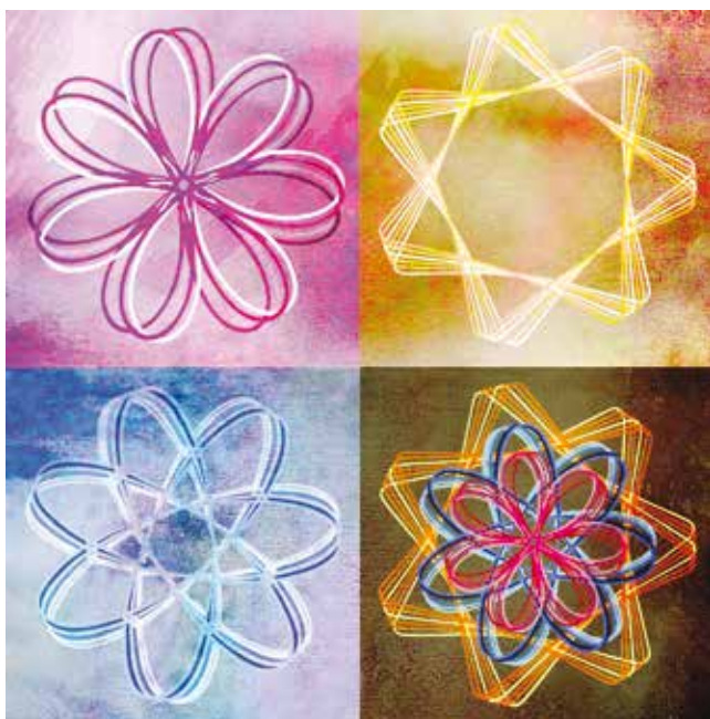
ILUSTRACIÓN: MA. LISSETTE ROJAS TEJEDA

“La dimensión Humanista es clave para la formación de toda persona, ya que implica que nuestra conciencia e inteligencia respondan a la realidad en la que vivimos y a ser sensibilizados para contribuir, de manera efectiva”