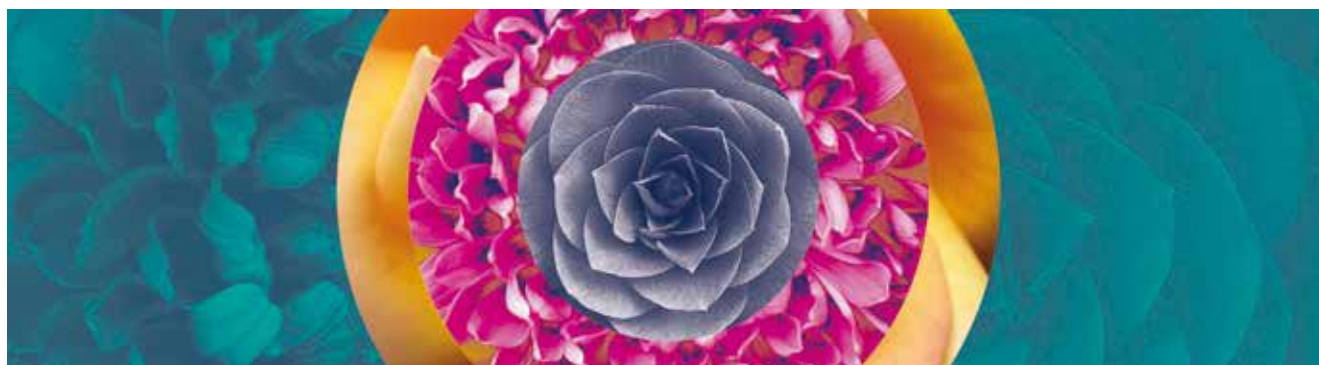
ILUSTRACIÓN: ARTURO CIELO RODRÍGUEZ

La Universidad Iberoamericana Puebla, como una de las obras educativas de la Compañía de Jesús, quiere hacer patente que, ante la crisis civilizatoria y medioambiental contemporánea en la medida de sus capacidades institucionales y en el marco de la Agenda Institucional 2020, declara su compromiso para: