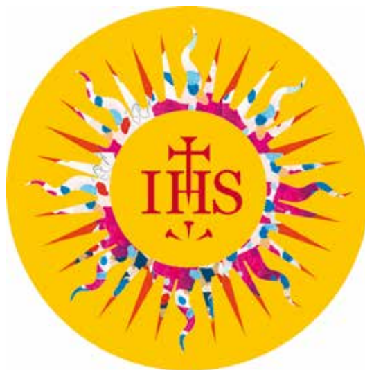
ILUSTRACIÓN: ARTURO CIELO RODRÍGUEZ

Muchas gracias por haber elegido nuestra Universidad, por ser parte de esta familia IBERO. Creyeron y ahora conocen nuestra filosofía y nuestro modelo educativo. Que la vida les demande lo que en estos años han aprendido.