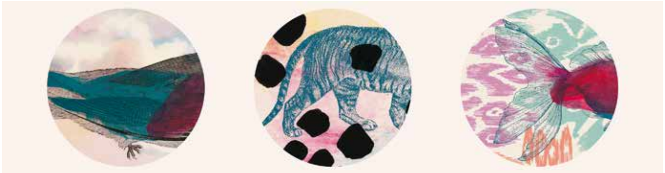
ILUSTRACIÓN: EDITH HERNÁNDEZ DURANA

Los humanos se han adaptado a vivir en casi cualquier tipo de medio, desde las grandes montañas a las densas junglas o las llanuras abiertas; adaptaciones que han sido posibles gracias a la evolución cultural y tecnológica que han desarrollado, además de su enorme capacidad de pensamiento racional y abstracto. Sin embargo, más grande ha sido la codicia y arrogancia del hombre que ha destruido y contaminado gran parte del planeta, basado en una idea errónea de que somos superiores al resto del mundo animal; olvidando por completo las enseñanzas de nuestros antepasados que creían firmemente que cada criatura viviente merece nuestro respeto. En cambio, cuando la naturaleza o los animales que lo habitaban se interponían, no hemos tenido piedad alguna a la hora de matar, expulsar, esclavizar y domesticar. Como consecuencia del crecimiento desmedido de la población humana, también ha aumentado la caza, la destrucción del medio ambiente, la contaminación, y el número de especies animales ha ido decreciendo hasta llegar a la extinción.